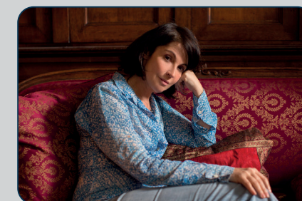
Zabou BREITMAN Présidente